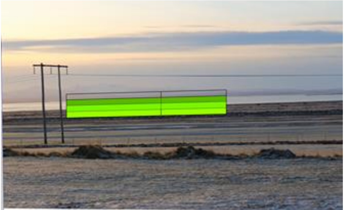
Mynd 4 Mynd tekin af bæjarhlaðinu á Magnússkógum 3. Grænn veggur tákna tré í 15 metra hæð við efri mörk nytjaskógarsvæðisins.

Mynd 4 sýnir sömu ljósmynd og mynd 3 en bara aðeins meira stækkuð. Græni veggurinn tákna tré í 15 metra hæð (hér er rauða stíkan þrefölduð upp).