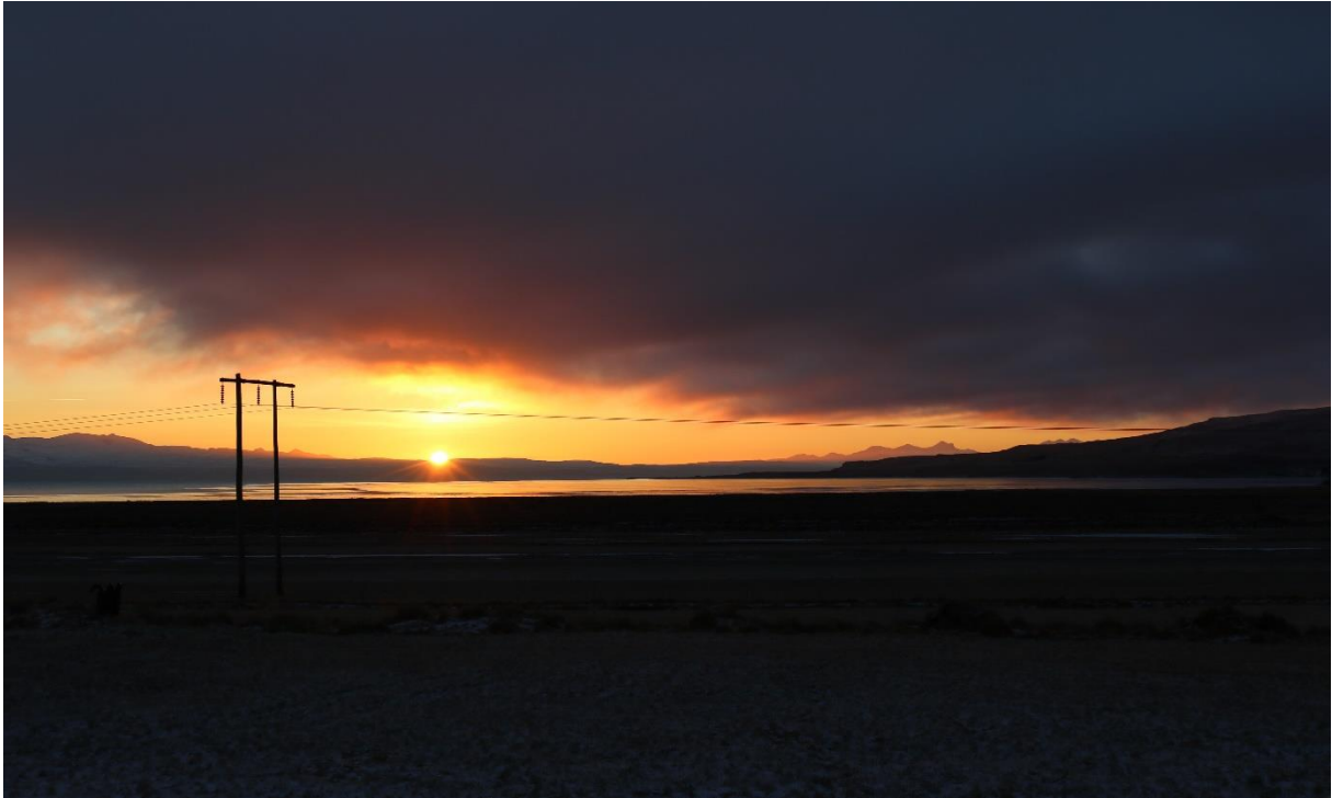
Mynd 8 Mynd tekin af bæjarhlaðinu á Magnússkógum 3.

Mynd 8 er tekin núna snemma í janúar og sólin er við það að setjast bakvið fjöllin með allri sinni litadýrð.