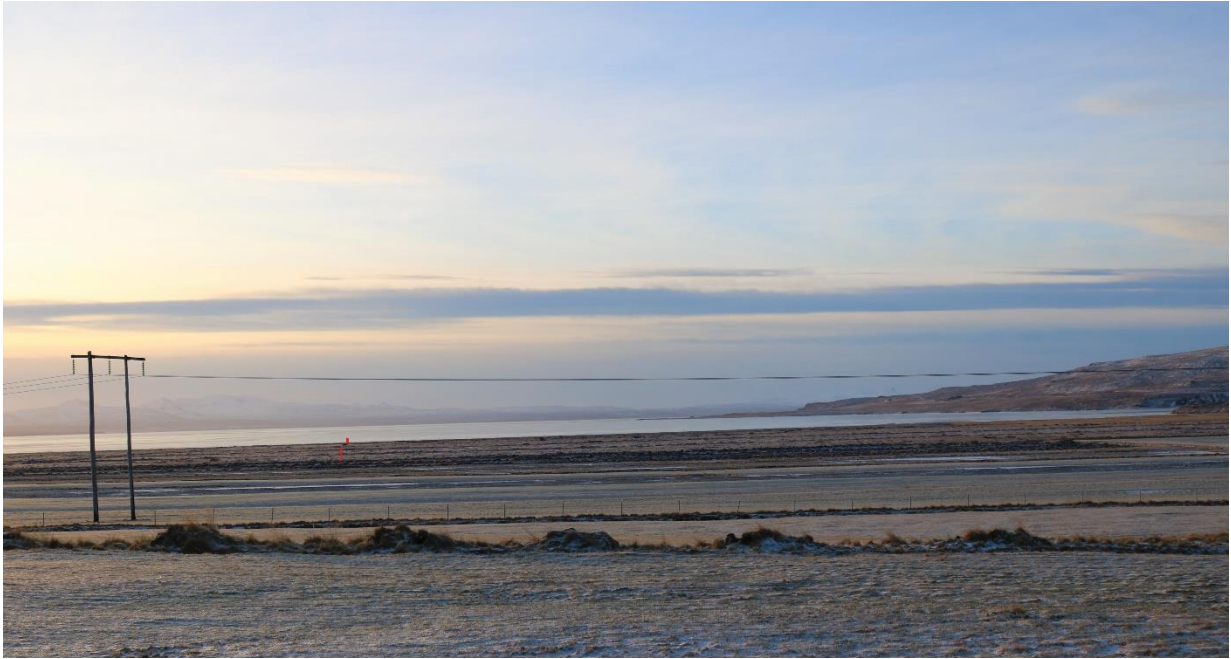
Mynd 3 Ljósmynd tekin af bæjarhlaðinu á Magnússkógum 3, horft yfir fyrirhugað nytjaskógarsvæði.

Mynd 3 er tekin af bæjarhlaðinu á Magnússkógum 3 og það svæði sem er hér fyrir neðan skurðruðningana, fyrir neðan ræktaða landið, er í eigu Skugga-Sveins ehf og tilheyrir þar af leiðandi Ásgarði. Á þessari mynd sést vel hvernig byggðarlínan skerðir útsýni okkar en hún er í um 12 metra hæð frá jörðu. Ef vel er rýnt í þessa mynd 3 getið þið einnig séð tvær rauðar stikur staðsettar hægra megin við byggðarlínustæðuna (gott að stækka skjalið til að sjá þær betur). Stikan sem er nær, er við efri brún Ásgarðslands og neðri stikan er við girðinguna niður við fjöru þar sem áætlað er að nytjaskógasvæðið endi. Báðar þessar stikur standa í 5 metra hæð frá jörðu. Við undirrituð komum þessum stikum tímabundið fyrir til að reyna að átta okkur á hvaða landslag mun hverfa ef þarna rís upp gróskumikill nytjaskógur.