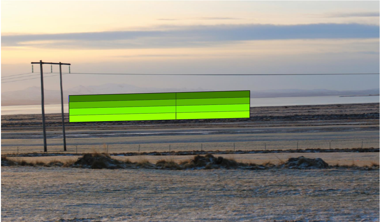
Mynd 6 Mynd tekin af bæjarhlaðinu á Magnússkógum 3. Græni veggurinn táknar tré í 20 metra hæð við efri mörk nytjaskógarsvæðisins.