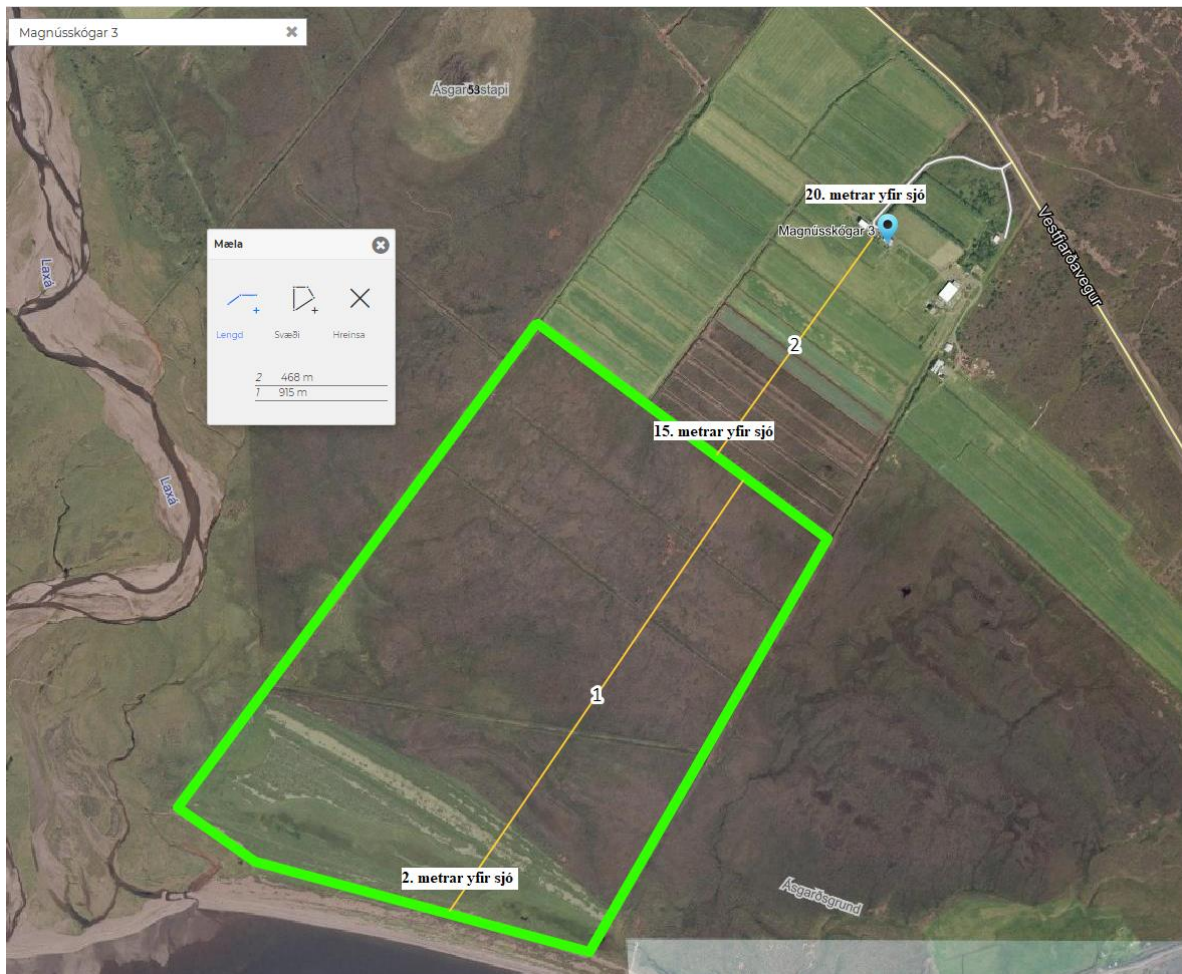
Mynd 1 Fyrirhugað nytjaskógarsvæði, afmarkað með grænum línun, fyrir neðan Magnússkóga 3.

Undirrituð vilja koma því á framfæri að samkvæmt bókun umhverfis- og skipulagsnefndar, varðandi þessa umsögn, þá samþykkir nefndin þetta erindi með tilliti til nýrrar flokkunar á landbúnaðarlandi í drögum að endurskoðun á aðalskipulagi Dalabyggðar 2004-2016, þar sem talið er að fyrirhugað nytjaskógarsvæði falli undir flokk II og III samkvæmt þeirri skilgreiningu. En vert er að geta þess að þó búið sé að flokka (gróflega) landbúnaðarland þá er enn ekki búið að gera greinarmun á því hvað er skógrækt og hvað er nytjaskógrækt. En samkvæmt upplýsingum frá starfsmanni Verkís hf er sú vinna í gangi varðandi nýtt aðalskipulag fyrir Dalabyggð og krefjumst við því, að beðið sé eftir að hún klárast.