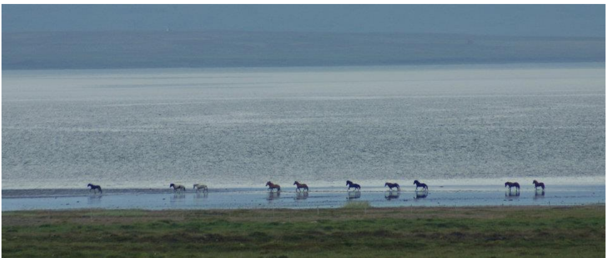
Mynd 9 Mynd tekin af bæjarhlaðinu á Magnússkógum 3 og sýnir ferð hesta um fjöruna.