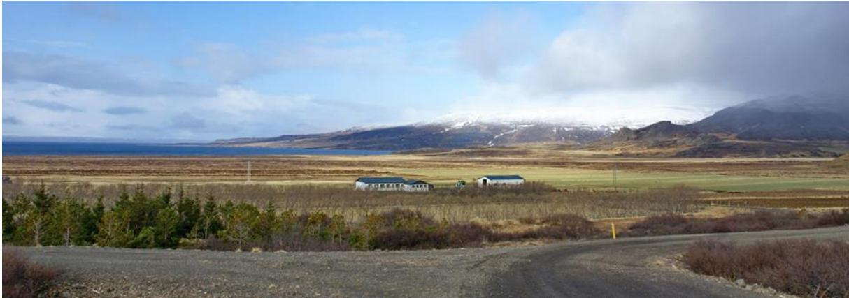
Mynd 2 Magnússkógar 3 og fyrirhugað nytjaskógarsvæði þar fyrir neðan.

Ljóst er að ef að fyrirhuguðum nytjaskógi verður hefur það gríðarleg áhrif á útsýni Magnússkógar 3 út á fjörðinn og á þann fjallgarð sem þar er á bakvið og til hliðar við hann.