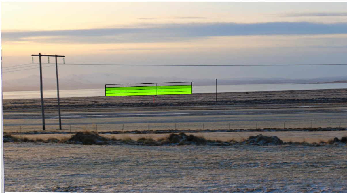
Mynd 5 Mynd tekin af bæjarhlaðinu á Magnússkógum 3. Græni veggurinn tákna tré í 15 metra hæð við neðri mörk nytjaskógarsvæðisins.

Mynd 4 sýnir sömu ljósmynd og mynd 3 en bara aðeins meira stækkuð. Græni veggurinn tákna tré í 15 metra hæð (hér er rauða stíkan þrefölduð upp).